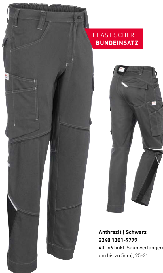
Anthrazit | Schwarz 2340 1301-9799 40–66 (inkl. Saumverlängerung um bis zu 5 cm), 25–31