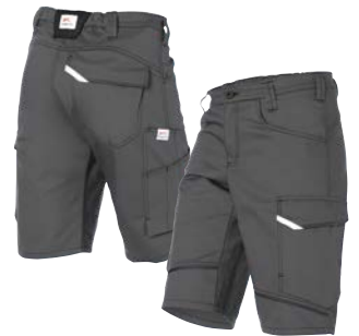
Anthrazit | Schwarz 2440 5336-9799 40-66