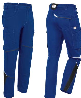
Kbl.blau | Schwarz 2340 1301-4699 40–66 (inkl. Saumverlängerung um bis zu 5 cm), 25–31