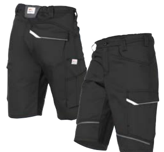
Schwarz | Anthrazit 2440 5336-9997 40-66