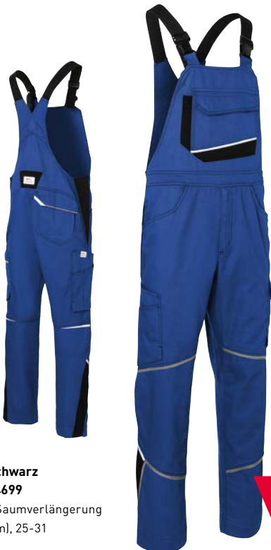
Kbl.blau | Schwarz 3140 5336-4699 40–66 (inkl. Saumverlängerung um bis zu 5 cm), 25–31