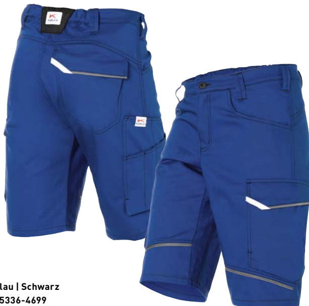
Kbl.blau | Schwarz 2440 5336-4699 40-66