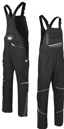
Schwarz | Anthrazit 3140 5336-9997 40–66 (inkl. Saumverlängerung um bis zu 5 cm), 25–31