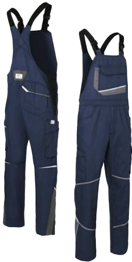
Dunkelblau | Anthrazit 3140 5336-4897 40–66 (inkl. Saumverlängerung um bis zu 5 cm), 25–31