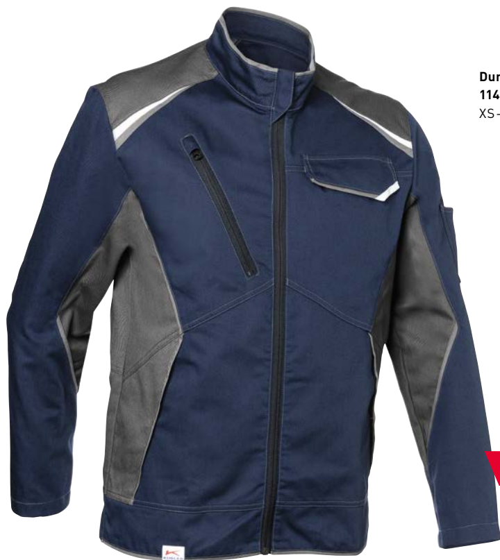
Dunkelblau | Anthrazit 1140 5336-4897 XS-4XL