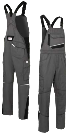
Anthrazit | Schwarz 3140 5336-9799 40–66 (inkl. Saumverlängerung um bis zu 5 cm), 25–31