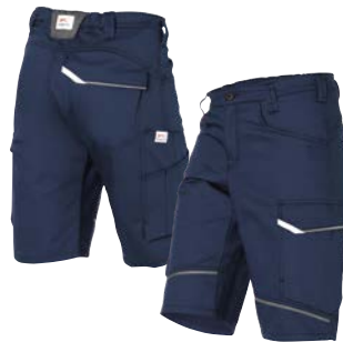
Dunkelblau | Anthrazit 2440 5336-4897 40-66